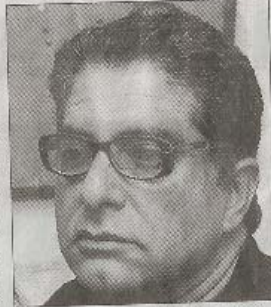
'We have everything we need'

Information, technology and even knowledge could make conventional warfare — and therefore superpowers — irrelevant. It would not help a superpower to