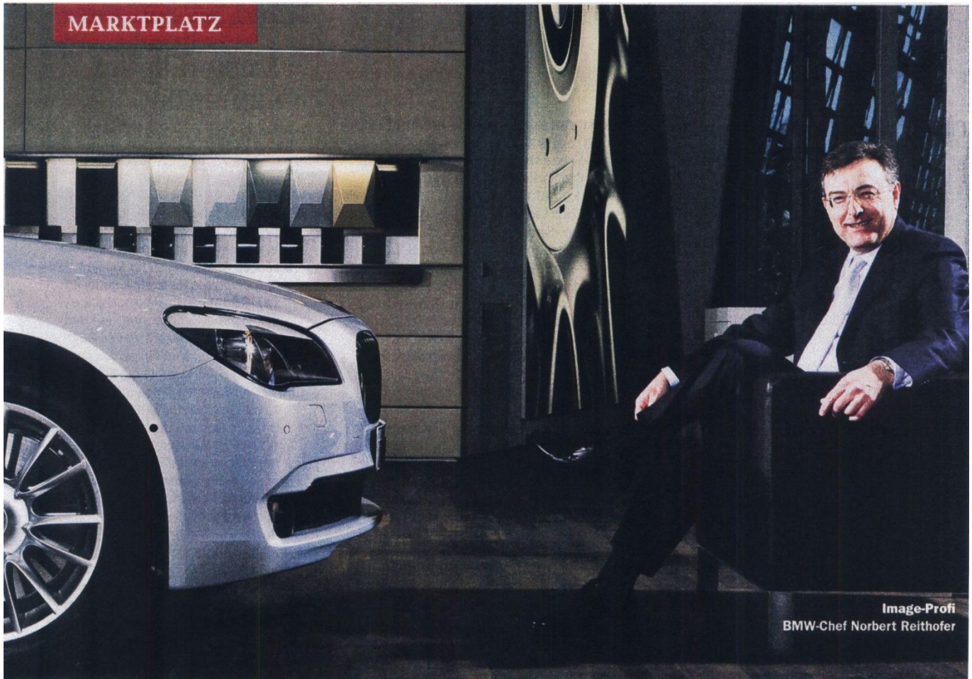
Image-Profi BMW-Chef Norbert Reithofer