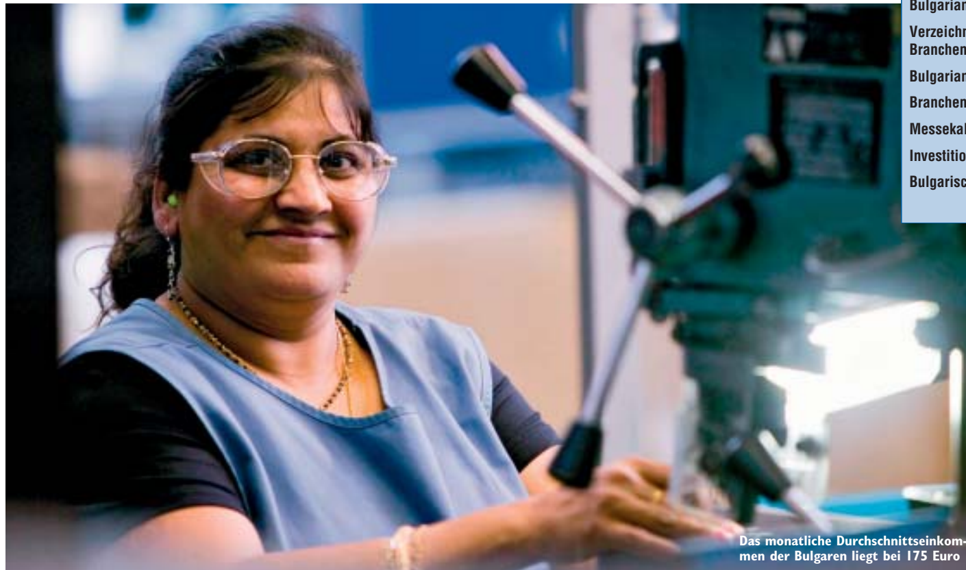
Das monatliche Durchschnittseinkommen der Bulgaren liegt bei 175 Euro

Weil das Land Teil der EU ist, weil die Löhne sagenhaft niedrig sind, weil es starke Branchen gibt wie Textil, Elektronik/-technik, Metallverarbeitung und Maschinenbau, weil eine starke Clusterbildung vorangetrieben wird und in den nächsten Jahren immense Summen in den Ausbau der Bereiche Transport und Logistik fließen. Warum also nicht?