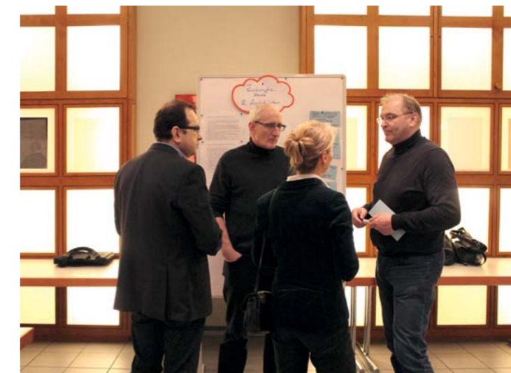
Interdisziplinärer Austausch als Ideenbasis für neue Anwendungen