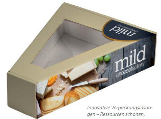
Innovative Verpackungslösungen – Ressourcen schonen, Verluste mindern

Diese Veränderungen werden sich drastisch auf die Papierindustrie auswirken, klare Risiken, aber auch Chancen bringen. Vor allem die Entwicklung CO 2 -neutraler Produkte wird zunehmend bedeutsam für eine breite Zustimmung zu papierbasierten Produkten auch bis zum Ende des Jahrhunderts. Eine weitere Produktdiversifizierung zur Erschließung neuer Märkte erscheint unumgänglich für den künftigen Erfolg der Papier- und Zellstoffindustrie.