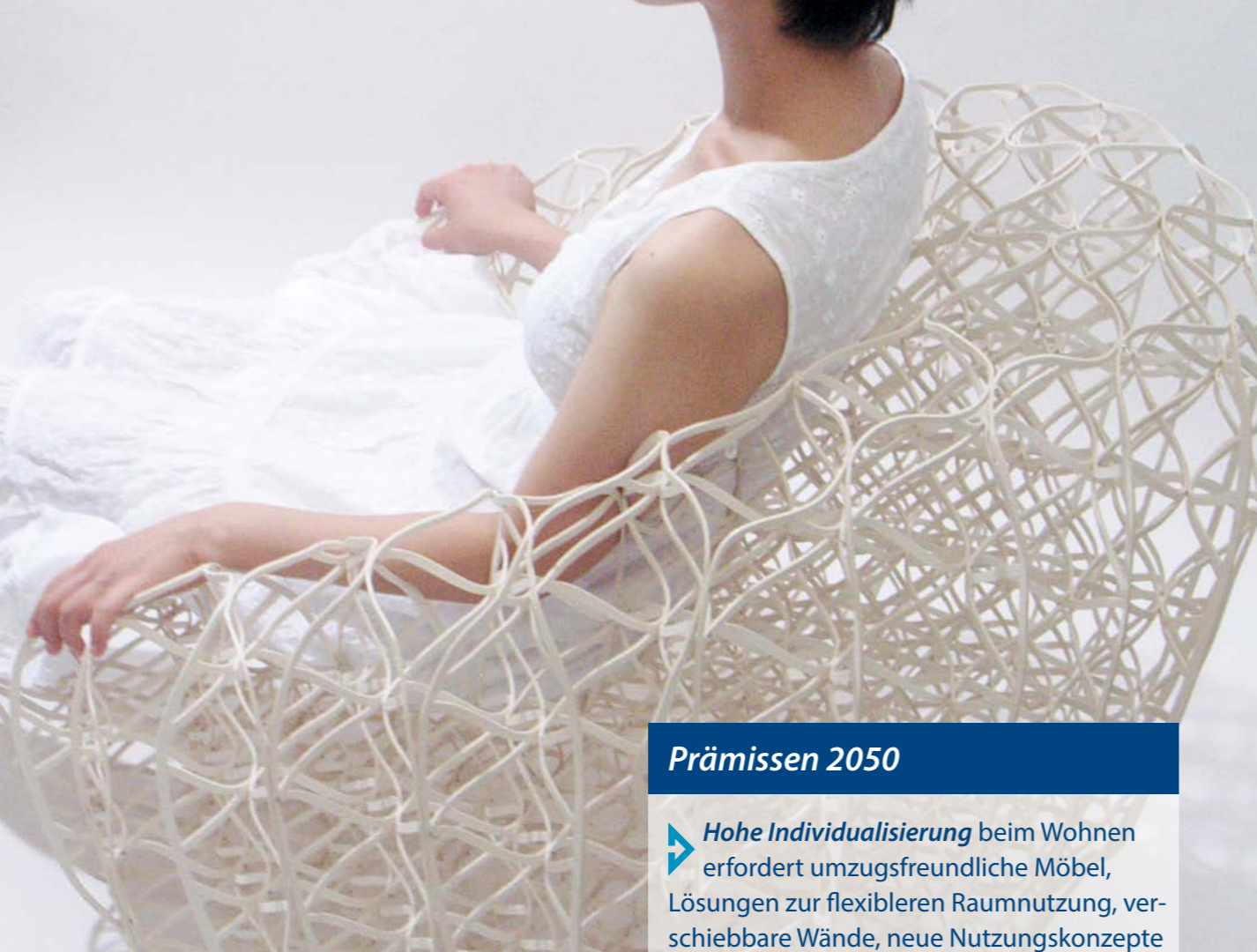
Faserbasiertes Sitzen – filigran und stabil zugleich