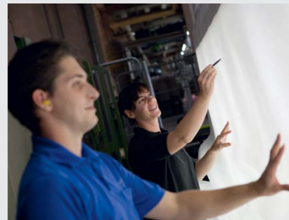
Fähige Mitarbeiter, modernstes Know-how ...