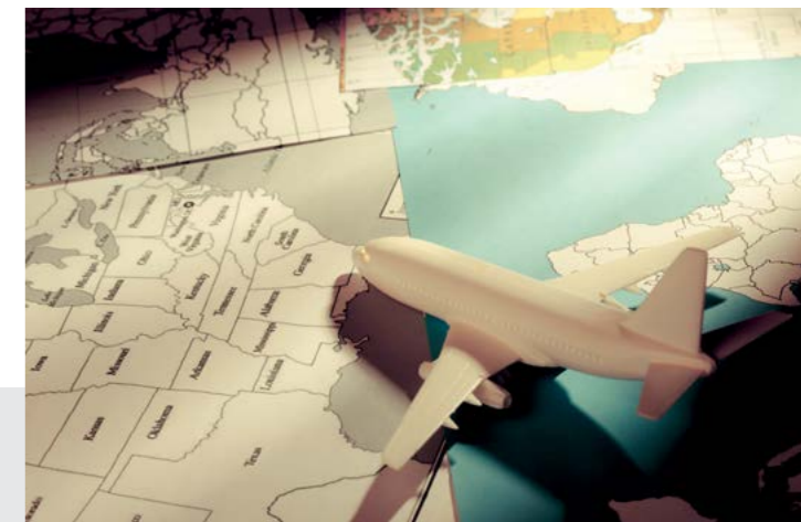
Einst Alu, heute Fasern – Werkstoff der Zukunft, nicht nur im Flugzeugbau

darfs, Stau ist inzwischen ein Fremdwort; selbst bei Hochgeschwindigkeit reicht der Sicherheitsabstand von einem Meter für kommunizierende Fahrzeuge völlig aus; dadurch vervielfachte Straßenkapazität. ▶ Schmutzschutz: Autowaschstraßen wurden Minusgeschäft; schmutzabweisende Oberflächen lassen Fahrzeuge jederzeit wie neu aussehen; Waschen entfällt.