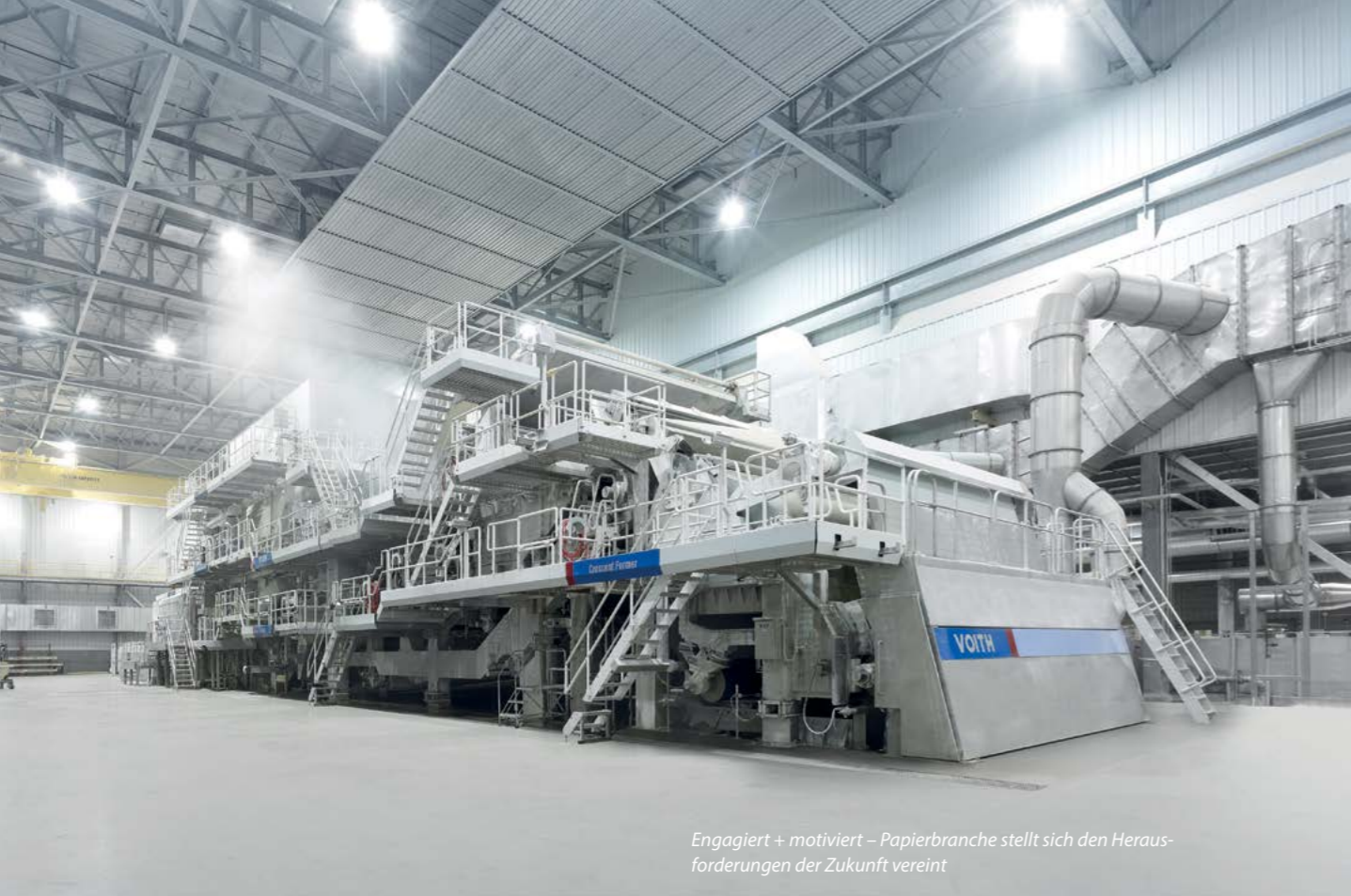
Engagiert + motiviert – Papierbranche stellt sich den Herausforderungen der Zukunft vereint