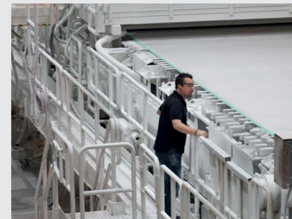
... als Bedingungen des Erfolgs von morgen