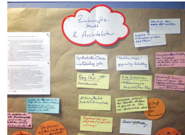
Denken in Themenlandschaften – geweiteter Blick für Bedarfe der Zukunft

währt habe. Den Blick zwischen fünf und 500 Metern voraus pendeln zu lassen, schütze vor Überraschungen und führe auf Dauer zu einer ruhigeren, gleichmäßigeren Fahrweise. Das sei für Mitfahrer im Auto angenehm – und ebenso für die Mitarbeiter eines vorausschauend agierenden Unternehmens.