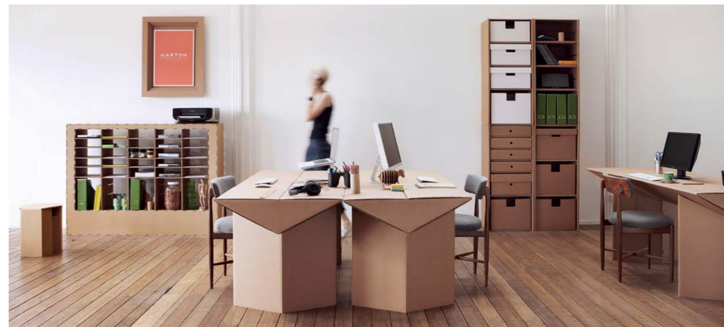
Flexibles Wohnen und Arbeiten – Zukunftsmärkte für faserbasierte Werkstoffe