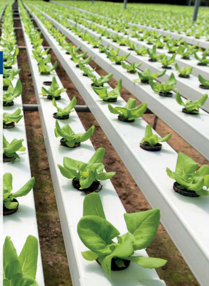
Rekultivier- und Hydropapiere für Aussaat und Aufzucht von Grünpflanzen

▶ Neue Technologien für die Trinkwasserversorgung: vielfach lokale und dezentrale Aufbereitung von Regen-, Brauch- und Abwasser.