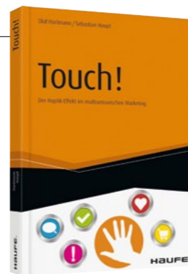
Marketing, Werbung und Verkauf zu tun haben. „Touch!“ ist 2014 im Haufe-Verlag erschienen und kostet 39,95 Euro; ISBN: 3648055097.

Wirk-Dimensionen von Attention (Aufmerksamkeit), Recall (Erinnerung), Integrity (Glaubwürdigkeit), Value (Wertschätzung) und Action (Kaufbereitschaft) anhand einer Vielzahl an Beispielen. Konkrete Anwendungstipps für die haptische Gestaltung insbesondere von Verpackungen und Werbemitteln, Messen, aber auch von Mobile Media, Fernseh- und Printwerbung machen das Buch zu einem praktischen Arbeitsinstrument für alle, die professionell mit Design,