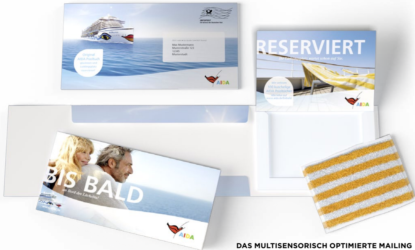
DAS MULTISENSORISCH OPTIMIERTE MAILING überzeugt 50 Prozent mehr Kunden.

auch ein „100-Meter-Lauf“ transportiert die Bedeutung von Leistung: Hier riechen wir Schweiß, sehen angespannte Muskeln und den Startblock, fühlen den rötlichen Schotterbelag und hören den Knall der Starter-Pistole. Welches Resonanzfeld attraktiver für die Zielgruppe