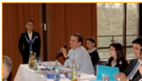
Benchmarking mit den Besten ...