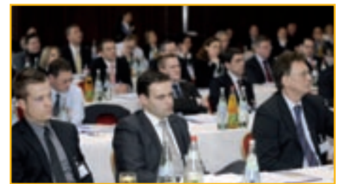
und intensiver Erfahrungsaustausch!