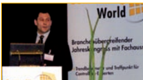
Spannende Praxisberichte, ...